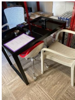
Table bureau à plateau verre noir 1er prix IKEA, 2 fauteuils de jardin et un tabouret sur roulettes